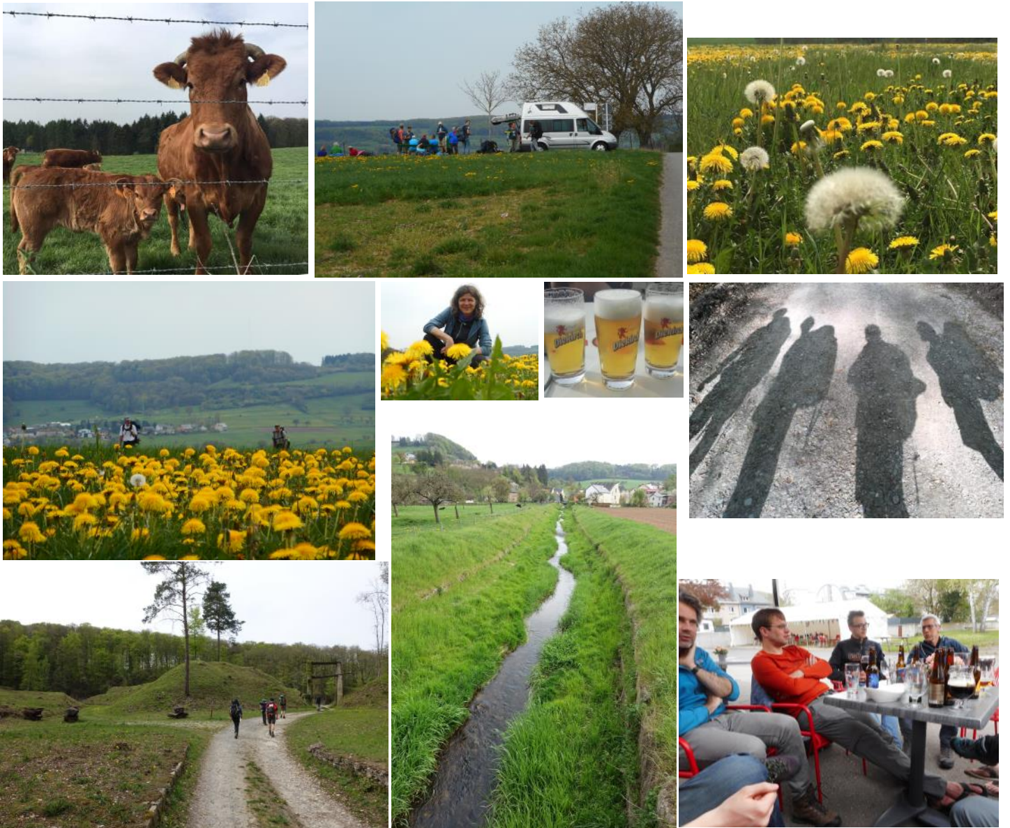
Verslag Paastocht 2019: In het spoor van kastelen, van Steinfort (bij Arlon) naar Burcht Bourscheid

Ook dag 5 werd wat langer en kwam op 25 km. Wij liepen eerst naar het kasteel van Larochette, waar we letterlijk direct onderlangs liepen, richting aanlokkelijke koffie met taart. Vervolgens hadden we een gevarieerde landschapelijke route via bossen en tussen weilanden door naar een welverdiende koffiestop bij Hans op een hoog plateau met view naar alle kanten. Was prachtig daar! Daarna liepen we door oude groeves het dal van de Sûre in. We kampeerden direct langs de Sûre bij Diekirch en gingen gezellig met z'n allen de stad in waar we in een pizzeria een hapje aten.