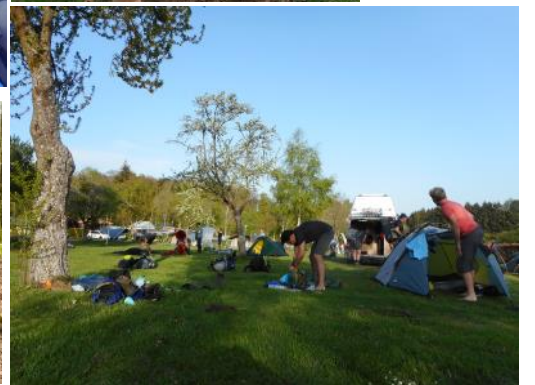
Verslag Paastocht 2019: In het spoor van kastelen, van Steinfort (bij Arlon) naar Burcht Bourscheid