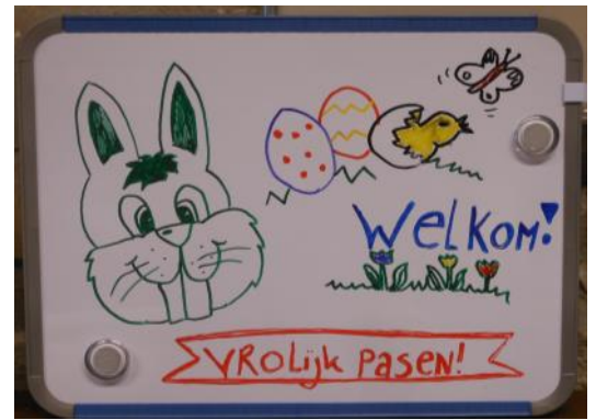
Hans haalde de bestelde verse broodjes bij de bakker en weer met vereende krachten stond er om 07.30 uur een perfect eigen Paasontbijt op tafel! Dank voor de medewerking!