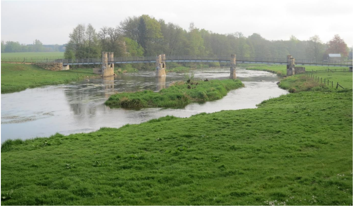
Op dag 5 wandelden we van Chassepierre naar Chiny. Onderweg stapten we van de Gaumeroute even over op de GR16, de GR langs de Semois. Onderweg was er weer veel moois te zien. We liepen hier duidelijk op de grens van Ardennen en Gaume.